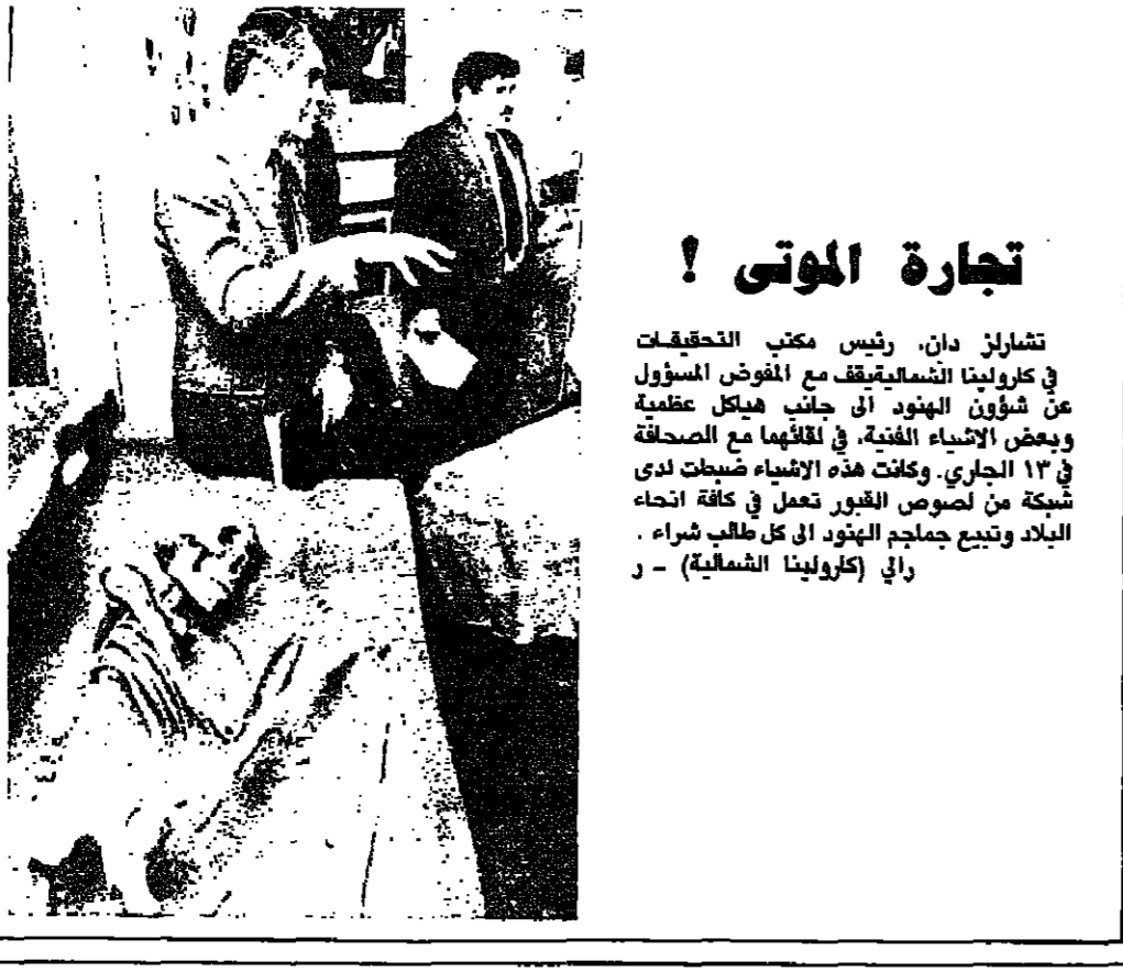
تشارلز دان، رئيس مكتب التحقيقات في كارولينا الشمالية يقف مع المفوض المسؤول عن شؤون الهنود ان جانب هيكل عظمية وبعض الاشياء الفنية، في لاثامها مع الصحفلة في ١٣ الجاري. وكانت هذه الاشياء ضحبات لدى شبكة من لصوص القبور تعمل في كافة أنحاء البلاد وتبيع جمجم الهنود الى كل طالب شراء. راي (كارولينا الشمالية) - ر